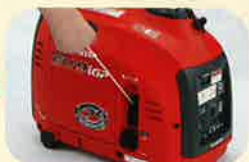
エンジンスイッチを 運転にして始動