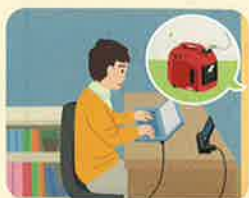
パソコン・携帯電話にも