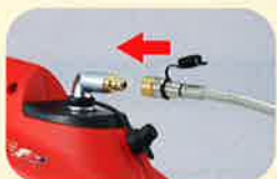
専用ガスコードを接続し ガス栓を開く